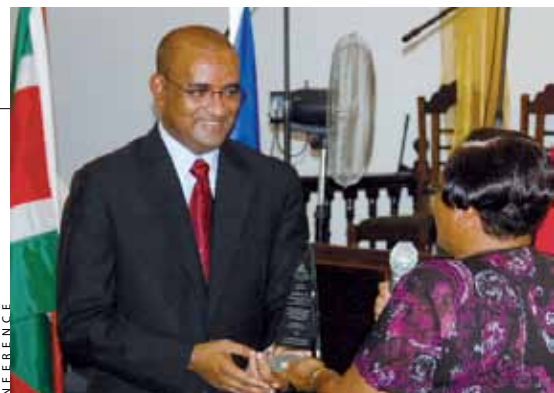
НАГРАЖДЕНИЕ РУКОВОДИТЕЛЯ: Бхарат Джагдео, президент Гайаны, принимает награду от адвентистской Церкви в этой стране за вклад в рост благосостояния народа Гайаны. Во время выступления на совещании Гайанской конференции 25 мая, Джагдео высоко оценил работу Церкви на благо общества.

Джагдео напомнил делегатам сессии, что для того, чтобы преобразовать общество, недостаточно лишь чтения новообращенным проповедей один раз в неделю.