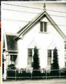
Разрушение в Хиросиме. Слева: Первоначальная адвентистская церковь в Хиросиме, посвященная 5 февраля 1917 года и снесенная японским правительством в 1945 году.

Казалось какой-то злой шуткой просить старшего пресвитера адвентистской церкви в Хиросиме наблюдать за разрушением его собственной церкви. Но это было лето 1945 года и японское правительство было категорично. По их словам, из-за участвовавших налетов авиации здание представляло собой источник пожароопасности, поэтому его нужно было снести.