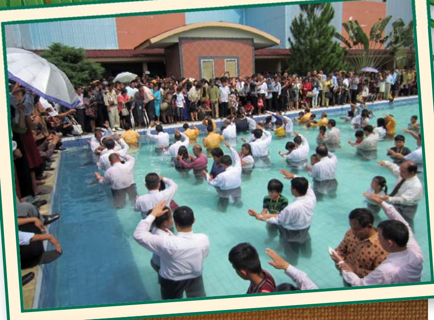
ЗНАМЕНАТЕЛЬНОЕ СОБЫТИЕ: Почти 2000 человек были крещены в результате евангельских встреч в Манадо.

шего Иисуса своим Спасителем и принявшего крещение!