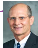
Тэд Вильсон, президент Генеральной Конференции Церкви адвентистов седьмого дня.

«Пусть никто и в мыслях не допускает, что мы можем обойтись без организации... От имени Господа я заявляю вам, что она должна существовать, укрепляться, утверждаться и развиваться... те, кто имеет помазание свыше, будут всеми силами поддерживать порядок, дисциплину и единство действий, и только тогда Божьи ангелы смогут сотрудничать с ними. Но эти небесные посланники никогда не поддержат... дезорганизации и беспорядка. Все это зло — результат усилий сатаны, направленных на ослабление наших сил, уничтожение нашего мужества и предотвращение успешной работы... Он умышленно уводит убежденных христиан как можно