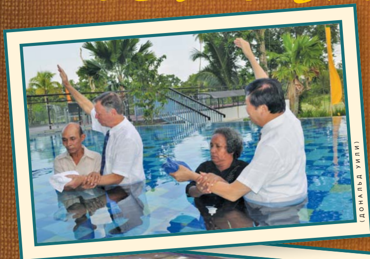
(ДО НАЛЬД УИЛИ)