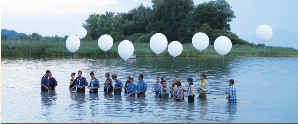
Крещение семи следопытов во время слета на швейцарском озере Ношатель.

Пол Ратсара, президент Южного Африканско-Индоевропейского дивизиона адвентистской Церкви, где расположены три из перечисленных учреждений, сказал, что проект является священным доверием Бога.