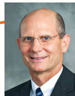
Тэд Вильсон, президент Церкви адвентистов седьмого дня.