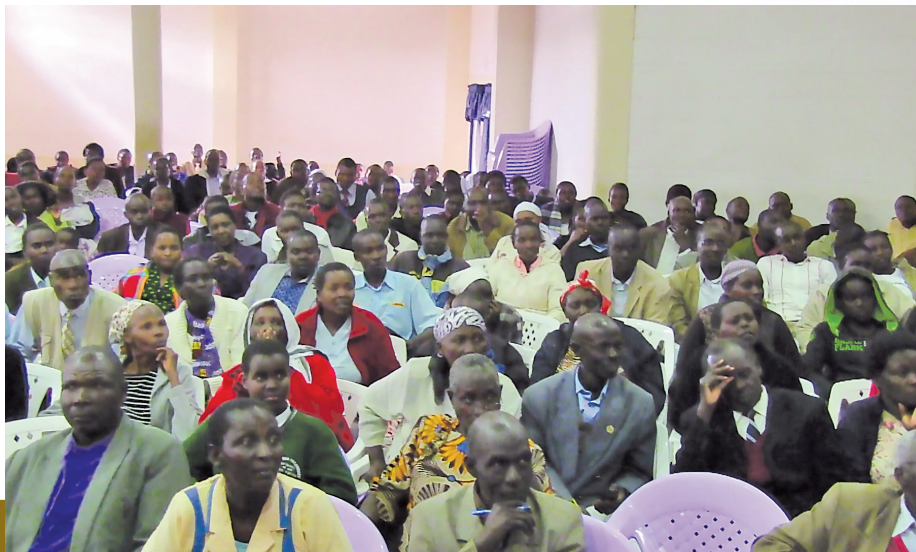
Молитвенные группы в Элдорете, Кения, возросли из нескольких десятков до несколько сотен, когда люди сосредоточились на молитве и возрождении.