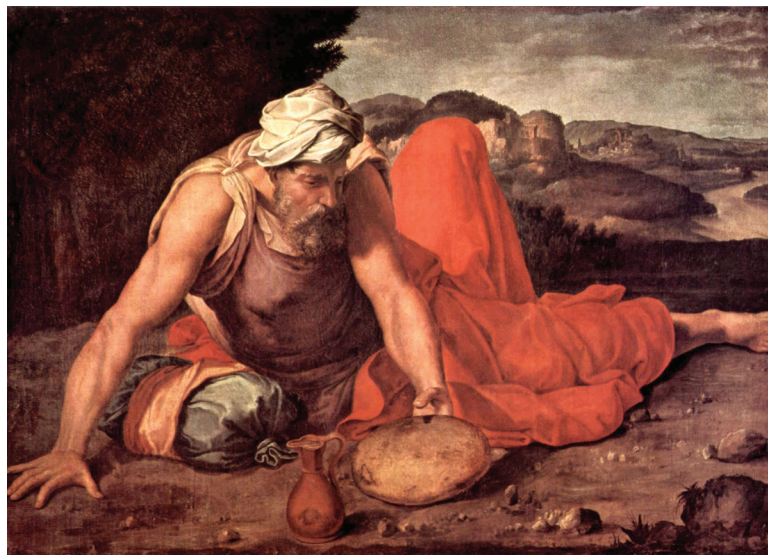
ДАНИЭЛЬ ДА ВОЛТЕРРА

В припеве одного старинного христианского псалма есть такие слова: «Доверяйте и будьте послушны, так как это единственный путь быть счастливыми в Иисусе, просто доверяйте и будьте послушны». Когда мы всецело доверяем Богу и с