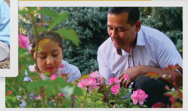
E S D