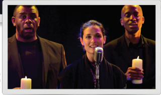
T E D