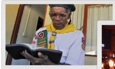
S I D