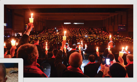
N S D