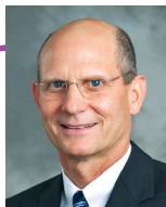
Тэд Вильсон, президент Церкви адвентистов седьмого дня.