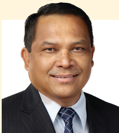
Леонардо Асой, президент Южного Азиатско-Тихоокеанского дивизиона Церкви адвентистов седьмого дня.