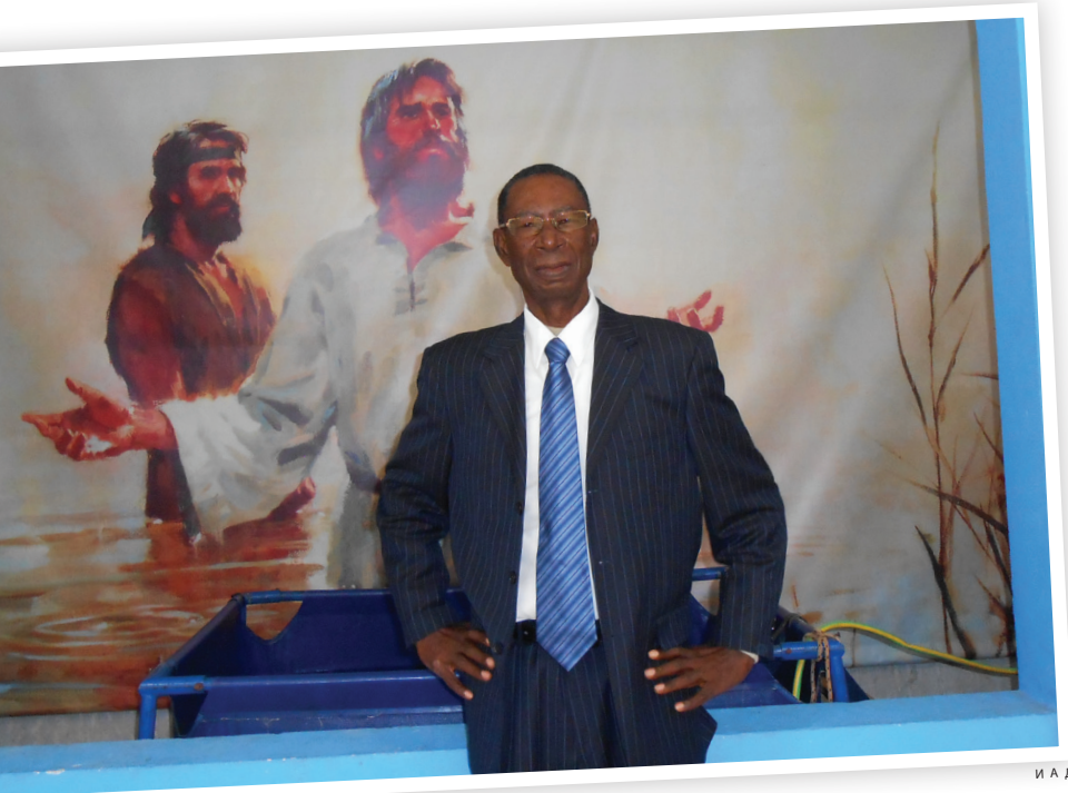
И А Д

Печатается в сокращении из оригинала, написанного Ройстоном Филбертом