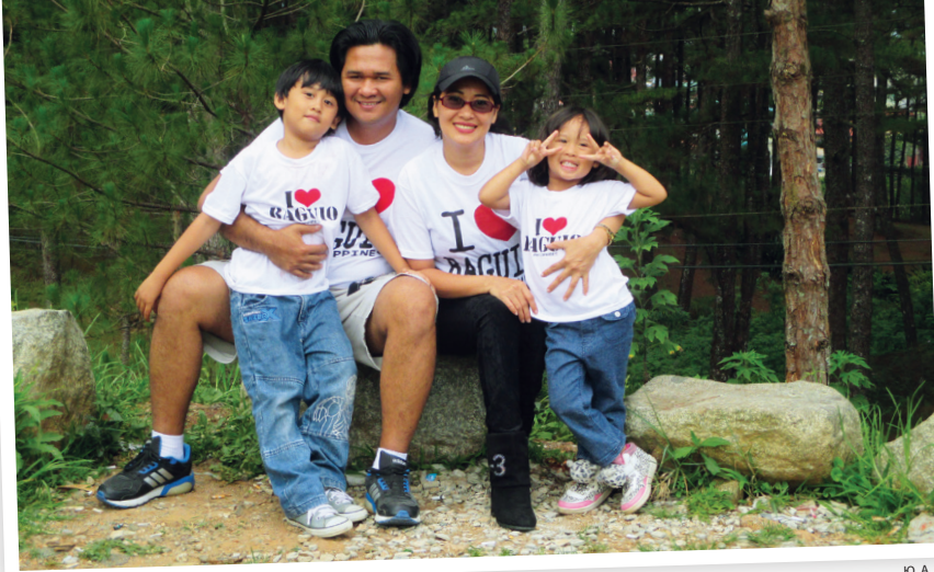
Ю А Т Д