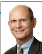
Тед Вильсон, президент Церкви адвентистов седьмого дня.