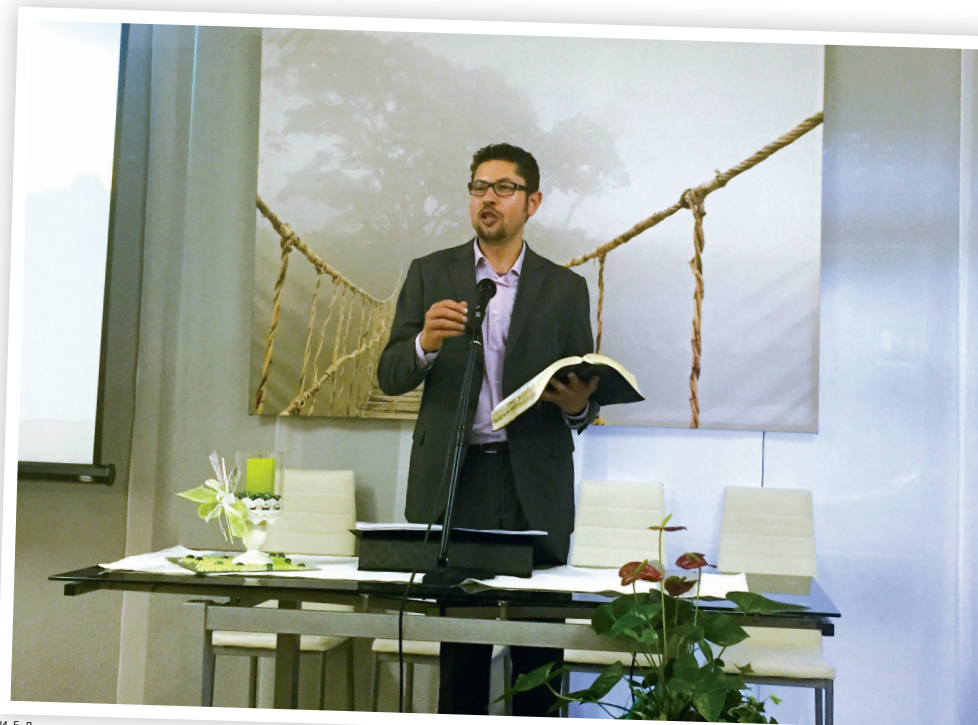
И Е Д

Каждую субботу в 9 часов утра, перед началом богослужения, члены и