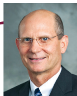
Тэд Вильсон, президент Церкви адвентистов седьмого дня.