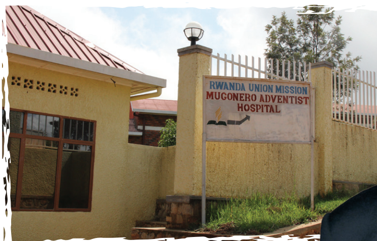
АДВЕНТИСТСКИЙ ГОСПИТАЛЬ МУГОНЕРО: Некоторые люди побежал к больнице, пытаясь избежать убийства, но были пойманы людьми, ожидавшими их с мачете.

Должен ли я простить даже убийц моей семьи во время геноцида в Руанде?