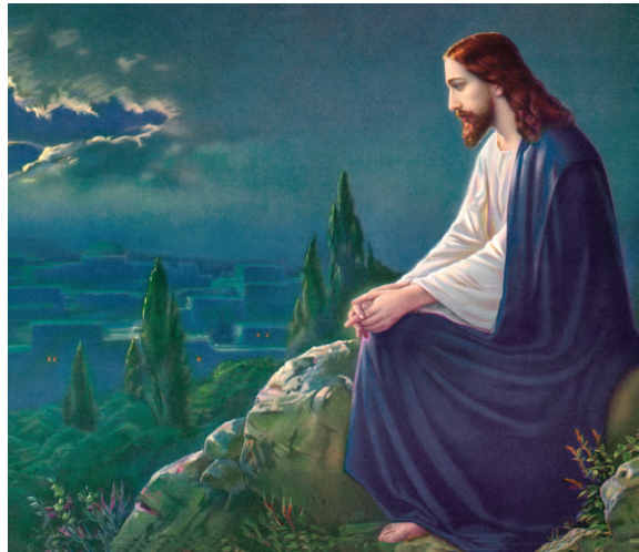
Д. ЖОВАННИ БЕЛЛИНИ

Иисус заверил Петра, что молился о нем, называя по имени. Какая сильная гарантия, что Иисус, будучи Сыном Божиим, знает наши имена и молится о нас. Какое ободрение для нас — присоединиться к Иисусу и, подобно Ему, молиться о других.