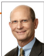
Тед Вильсон, президент Церкви адвентистов седьмого дня.