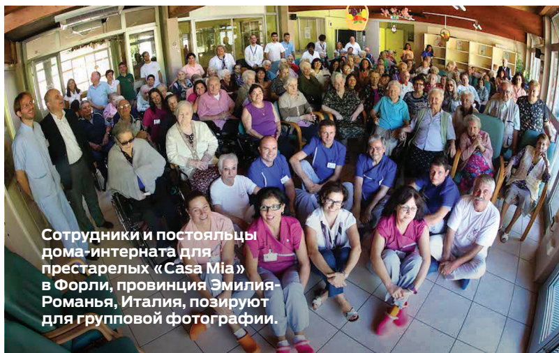
Сотрудники и постояльцы дома-интерната для престарелых «Casa Mia» в Форли, провинция Эмилия-Романья, Италия, позируют для групповой фотографии.

Дополнительная информация взята из Hope Media Italia.