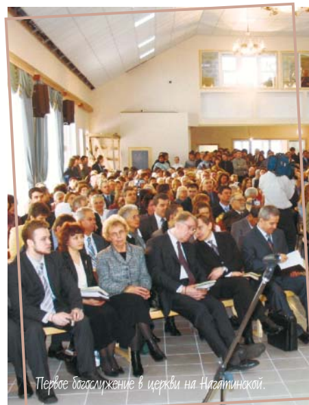
Первое богослужение в церкви на Нилатинской.