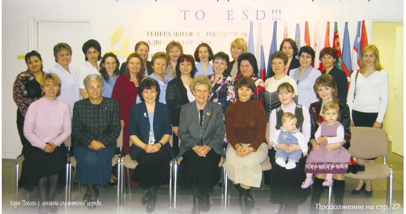
Кэри Толсен с женами служителей церкви.

— Комиссия, о которой вы упомянули, первый раз соберётся для работы весной текущего года в американском городе Лома Линда в контексте весеннего совещания ГК, поэтому об этом преждевременно говорить. Я обратился к этому комитету, когда он только был сформирован, и сказал следующее: важно помнить, что существующая церковная структура возникла более 100 лет тому назад, в то время в мире было всего 75 тысяч адвентистов. Сегодня мы должны задать вопросом: является ли существующая ныне структура всё ещё результативной, когда адвентистов уже насчитывается многие миллионы? Наша Церковь становится огромной, поэтому, естественно, усложняются все процессы внутри нее. Например, расходуются большие средства, поэтому надо за-