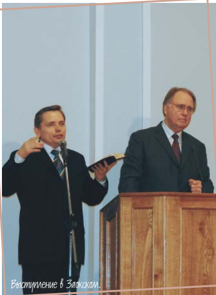
Выступление в Златокам.

Впервые я посетил Советский Союз почти 25 лет назад, и, конечно, тогда было все по-другому. Изменилась Россия, изменилось время. Особо заметны изменения в общественной жизни, и это отразилось на деятельности нашей Церкви. Я вижу, что адвентисты сейчас — как единая семья. Все структурные организации объединены в одно целое. Это было невозможно сделать ранее на территории Советского Союза, но осуществилось в полной мере сейчас. И это прекрасно. Мы должны держаться друг друга.