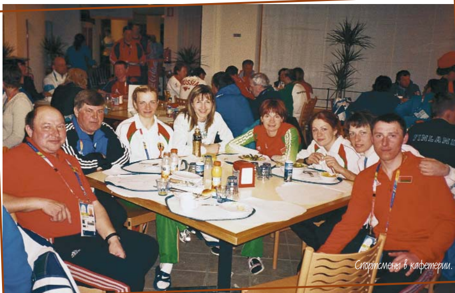
Спортсмены в кафетерии.

Находясь недавно в Италии, я встретила со своим бывшим тренером (он до сих пор тренирует сборную Беларуси). Он пригласил меня вернуться в сборную, сказав, что на этот раз суббота не будет проблемой, т.к. изменилась система тренировок и проведения турниров.