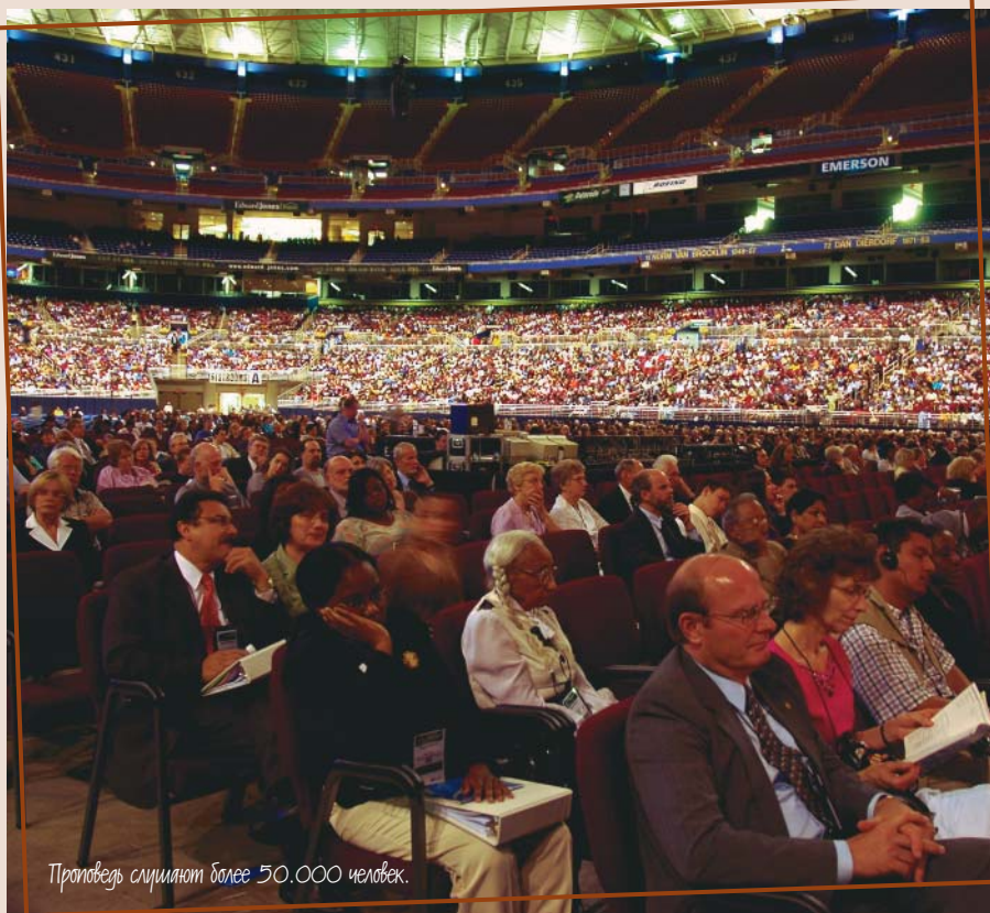
Проповедь слушают более 50.000 человек.

Мы неустанно должны рассказывать о жизни и смерти Иисуса Хрис-