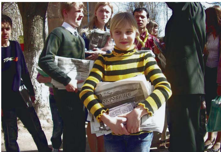
Во время полугодового совещания молодежь распространяла газету «Сокровище».

Прежде чем послать Своих учеников, а также всех нас, Иисус говорил, что будет нелегко. «Но вся власть, вся сила принадлежит Мне — посему идите, и Я буду с вами». Сколько времени Он будет с нами? До скончания века!