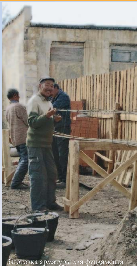
Заготовка арматуры для фундамента.

На северо-западе Монголии возводится адвентистская церковь, которую очень ждут местные верующие