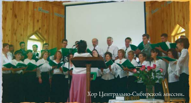
Хор Центрально-Сибирской миссии..