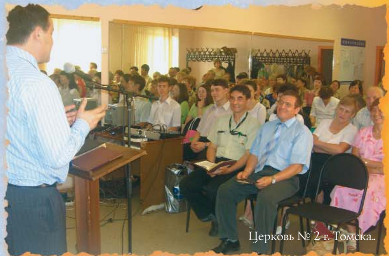
Церковь № 2 г. Томска..