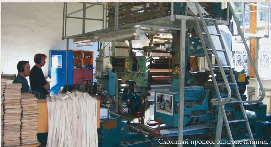
Сложный процесс книгопечатания.

Кроме этого мы приступили к достаточно серьезному проекту, аналога которому нет на территории бывшего Советского Союза — это пять томов под названием «Семейная медицина». Есть очень много книг, которые касаются этой темы, но это издание по сути своей похоже на книгу Миттлайдера «Огородный доктор»: когда вы смотрите на фотографию растения, то можете определить, чего ему не хватает, — так и в этом пятитомнике. «Семейную медицину» написал известнейший австралийский профессор, который обладает огромным авторитетом не только в Австралии, но и во многих странах мира, у него взять интервью считается большим достижением. Директор издательства в Австралии, которое на протяжении последних двух лет издавало эту книгу, рассказывал мне, каким спросом она пользуется. Редакция австралийского издательства проявила глубокое уважение и христианское понимание, предоставив нам эту книгу для издания, хотя вложила в подготовку этого труда более 600 тысяч долларов. Цветные иллюстрации взяты из медицинских архивов Австралии, и мне кажется, что только единицы издательств в мире имеют возможность