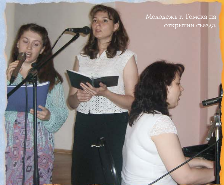
Молодежь г. Томска на открытии съезда.