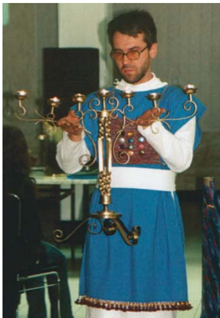
Первосвященник со светильником.

Как радостно сознавать, что есть Первосвященник, Который берет на себя наши грехи и омывает их Своей кровью. Нужно лишь принять Его прощение.