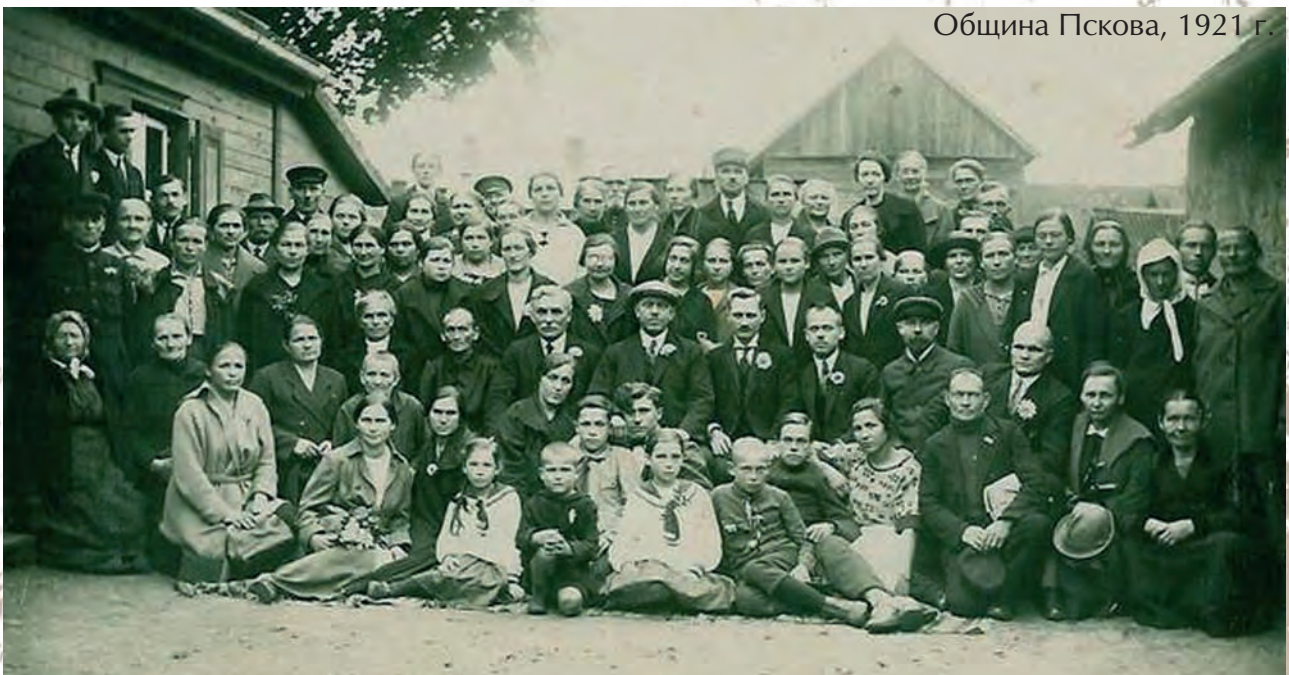
Община Пскова, 1921 г.