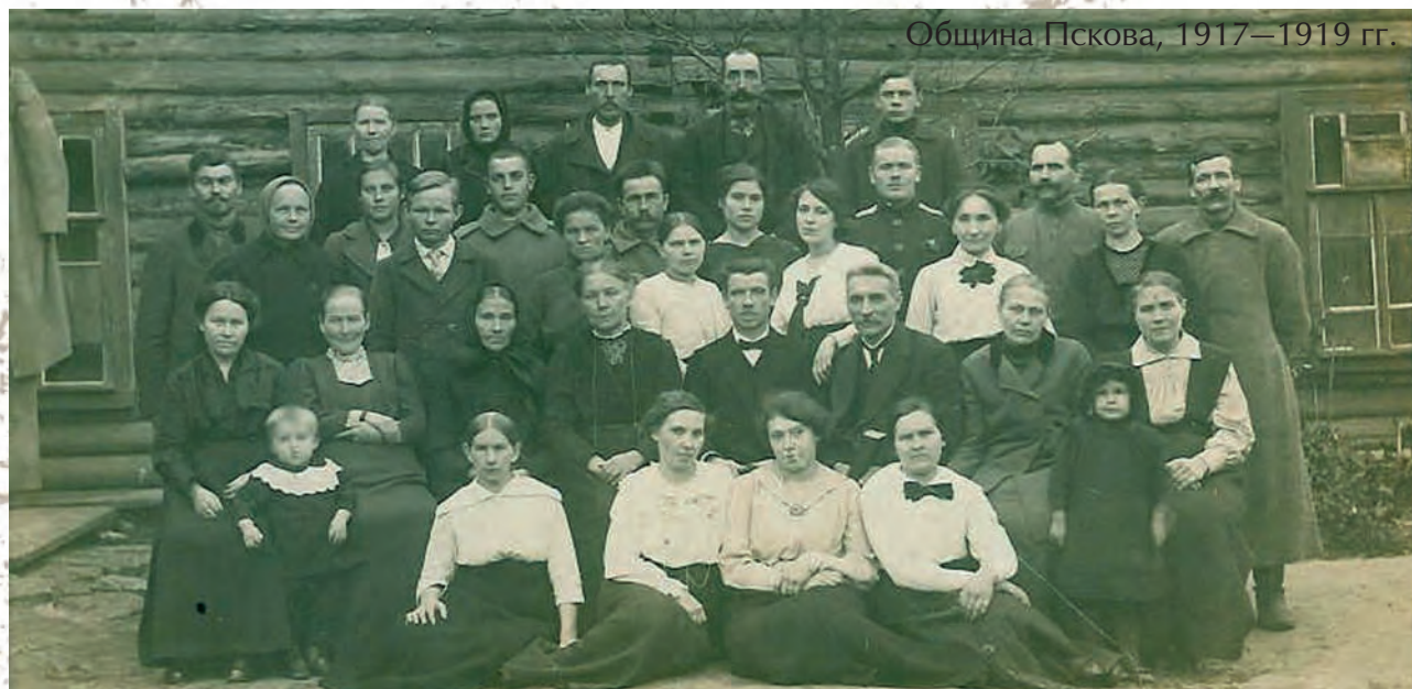
Община Пскова, 1917–1919 гг.