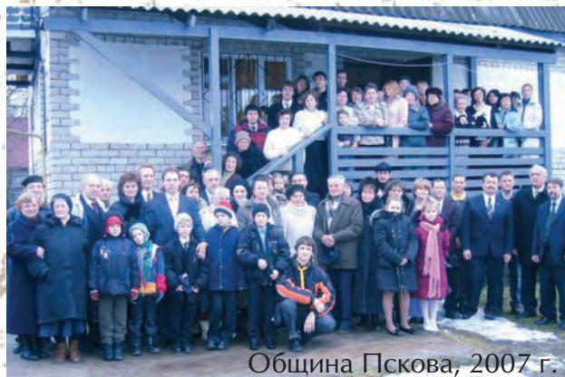
Община Пскова, 2007 г.