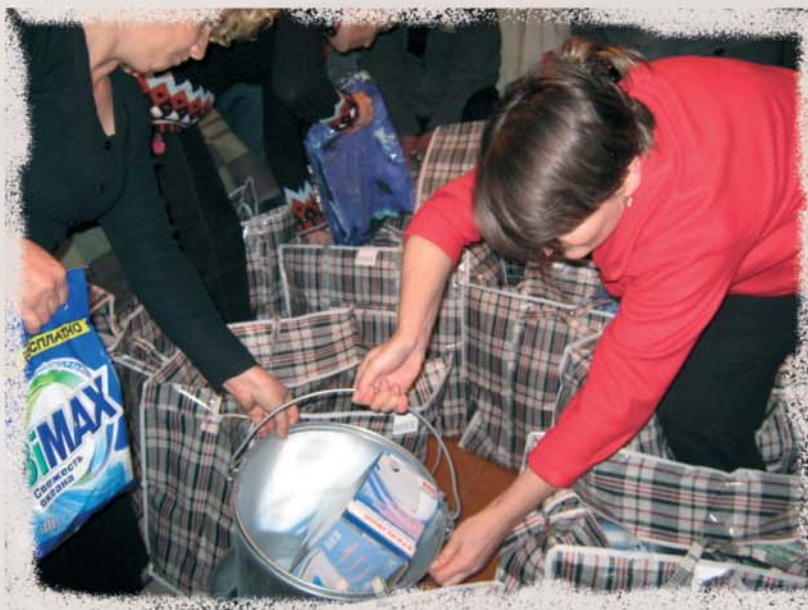
Члены церкви из Южной Осетии помогают упаковывать сумки с гуманитарной помощью

В результате этой благотворительной акции