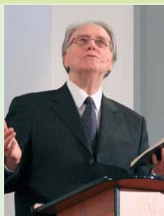
Ян Полсен, президент Генеральной Конференции