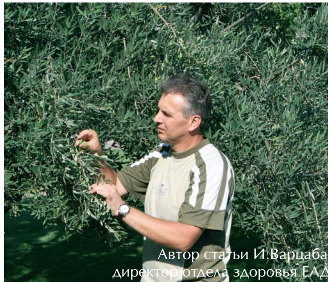
Автор статьи И. Варцаба, директор отдела здоровья ЕАД

Пророк Исаия уподобляет будущее бедственное положение народов и города Дамаска обитому масличному саду (Ис. 24:13): «А посреди земли, между народами, будет то же, что бывает при обивании маслин,... когда кончена уборка». Особенно были богаты масличными рощами земли с мягким климатом, находившиеся на северо-западе и в долине Акко, в верхней и нижней частях западной Галилеи, а также в районах, расположенных за финикийскими городами Тир и Сидон и в западной части Изреельской долины. Эти земли входили в удел колена Асира, восьмого сына библейского патриарха Иакова. Отсюда везли на средиземноморские рынки оливки и оливковое масло, елей, масличный жмых. Поэтому, благословляя свой народ, пророк Моисей сказал об Асире: «Благословен между сынами Асир, он будет любим