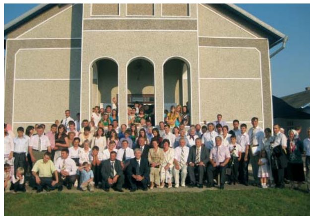
Карапчивская церковь во время празднования юбилея

Так начиналась история одной церкви на Буковине (Украина). Впервые Трехангельская весть в селе Карапчив прозвучала в 1929 году, а уже в 1933 году здесь была основана церковь АСД. К 1939 году она насчитывала более 50 человек.