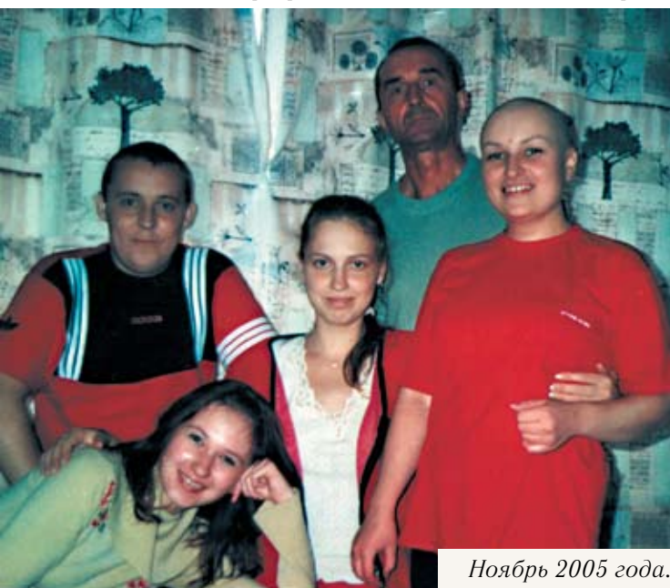
Ноябрь 2005 года.