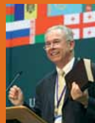
Билл Биаджи, президент ЕАД