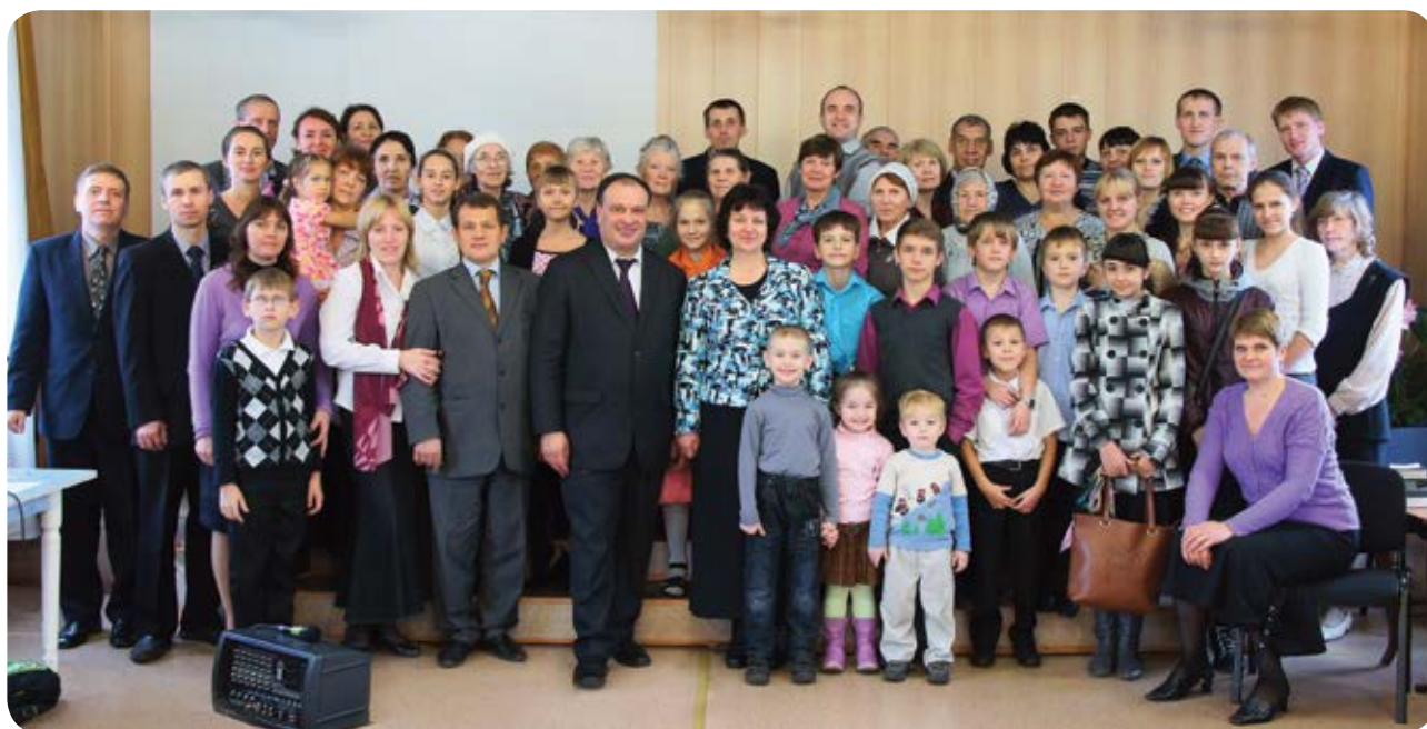
Община Церкви АСД в городе Междуреченске