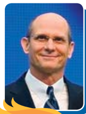
Тед Вильсон, президент ГК АСД

Составляя конкретные планы миссионерской работы в городах, мы сталкиваемся с великой борьбой между Христом и сатаной. Дьявол заявляет свои права на города. Но наступило время добиться, чтобы жители городов обратились к Богу! Наш мир отступил от Бога и наполнен циниками и вдохновленными сатаной демагогами, использующими любую возможность, чтобы насмеяться и разрушать все, что имеет отношение к истине. Они искажают и извращают библейскую истину так, чтобы она отрицала власть Творца, Икупителя и всемогущего грядущего Царя. Разумеется, в городах есть хорошие люди и совершаются добрые дела. Но в городах также сосредоточено зло, так как там проживает множество неверующих людей, присутствуют тщеславие и гордыня. Это всегда имело место с тех пор, как грех вошел в наш мир, а сосредоточенные в городах массы людей стали обращать свой взор на себя, а не на их Создателя. Бог повелевает нам, как когда-то Еноху, войти в города, имея силу Его правды, что-