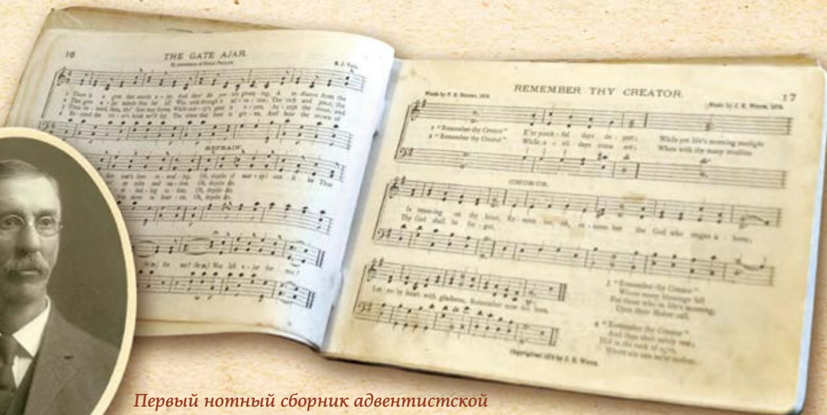
Первый нотный сборник адвентистской Церкви, изданный Эдсоном Уайтом в 1878 году.