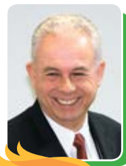
Билл Биаджи, президент ЕАД

Обращаясь ко всем участникам и гостям Годичного совещания ГК 2013 г., пастор Вильсон подчеркнул важность благословений, получаемых от интегрированного служения в больших городах, когда различные виды служения в церкви объединяются. Через Дух Пророчества Бог, заботясь о нуждах людей, открыл нам важность проповеди Евангелия через интегрированное служение. 19 октября 2013