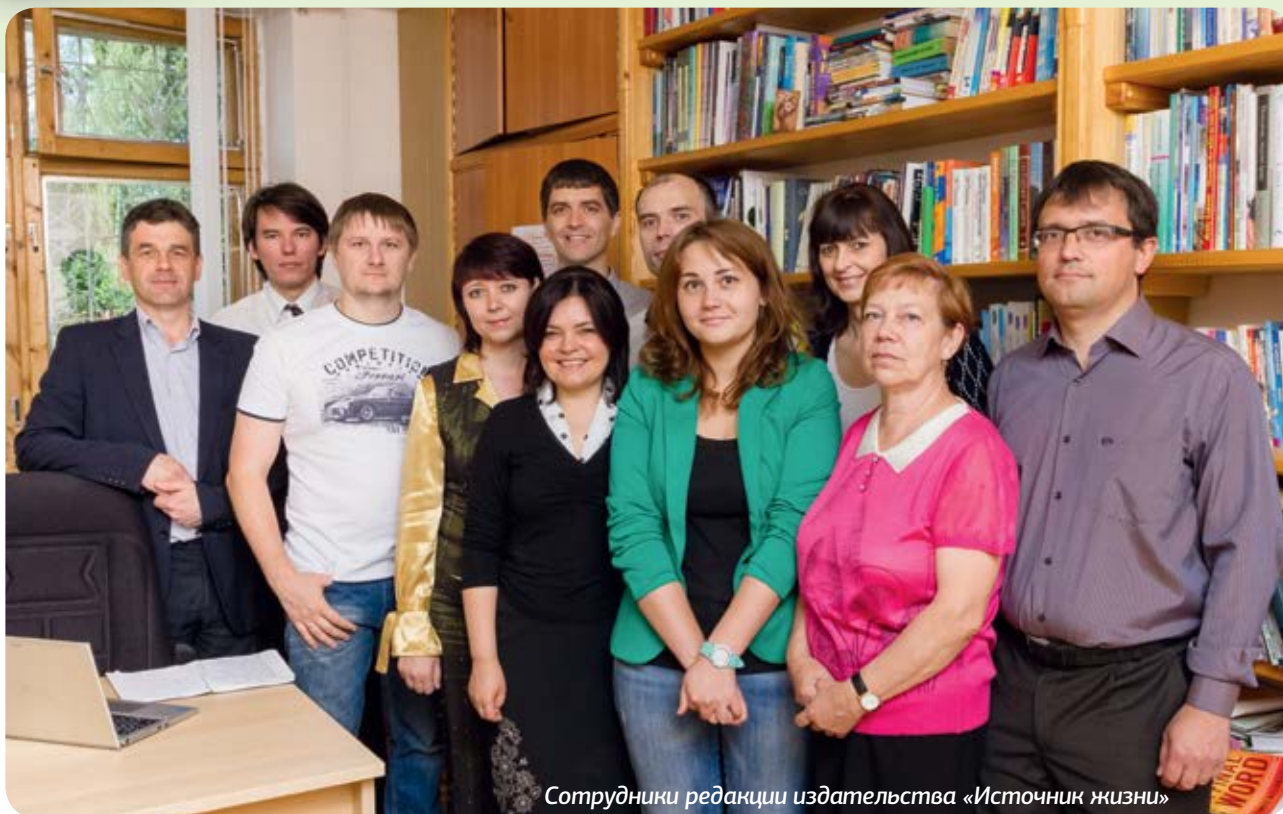
Сотрудники редакции издательства «Источник жизни»

Вестница Божья говорит: «Распространение журналов о здоровье является могущественным средством