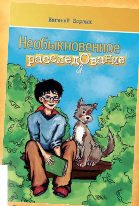
Детская миссионерская книга 2014 г.