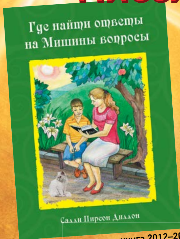
Детская миссионерская книга 2012–2013 гг.