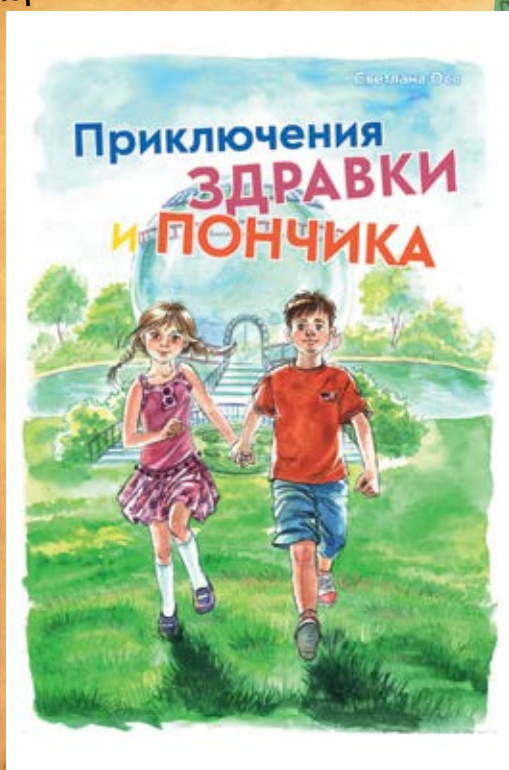
Детская миссионерская книга 2015 г.