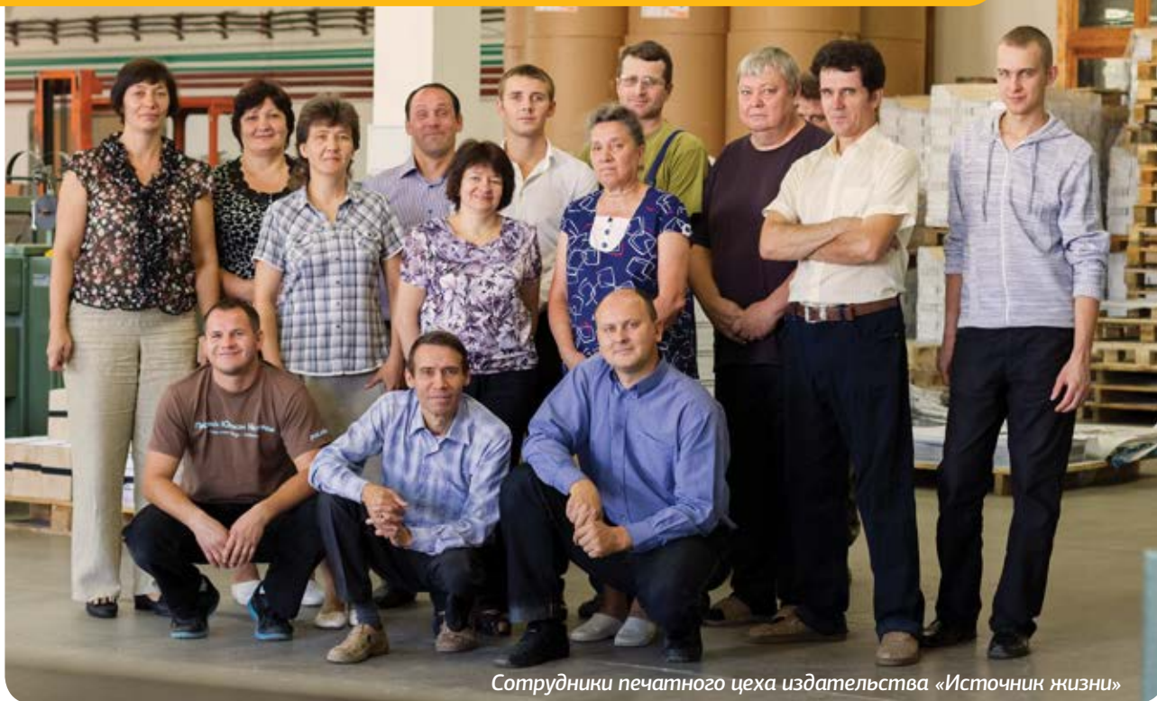
Сотрудники печатного цеха издательства «Источник жизни»