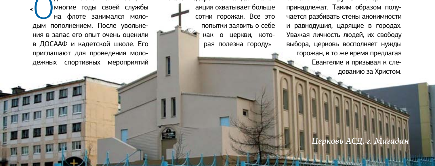
Церковь АСД, г. Магадан

Верные Богу в первую очередь призваны идти в мир без страха, идти навстречу горожанам: в повседневных делах и труде, индивидуально и семьями, вместе с общиной или в составе малых групп, к которым они принадлежат. Таким образом получается разбивать стены анонимности и равнодушия, царящие в городах. Уважая личность людей, их свободу выбора, церковь восполняет нужды горожан, в то же время предлагая Евангелие и призывая к следованию за Христом.