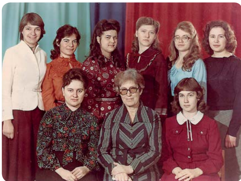
Первый выпуск дирижерских курсов, г. Тула, 1983 г.