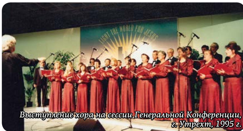
Выступление хора на сессии Генеральной Конференции, г. Утрехт, 1995 г.

у нас, но есть случаи, когда дети отказываются от родителей, и если вы откажетесь, то мы найдем вам педагога, который возьмет вас». Вот такие времена были. Конечно же, я не сделала этого.