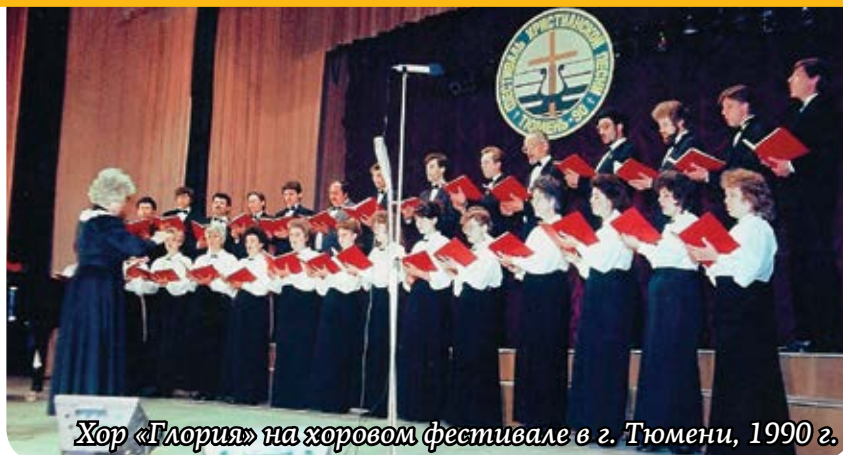
Хор «Глория» на хоровом фестивале в г. Тюмени, 1990 г.