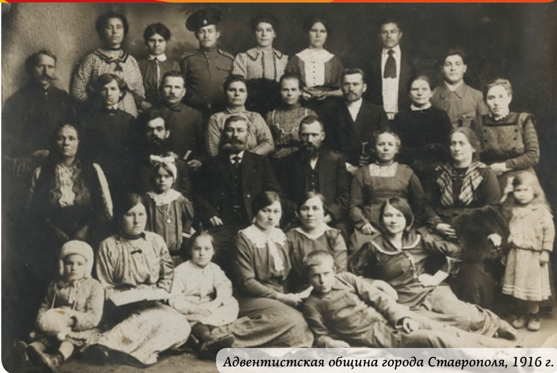
Адвентистская община города Ставрополя, 1916 г.