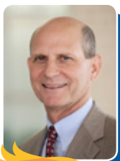
Тед Вильсон, президент Генеральной Конференции Церкви АСД

Обратите внимание на следующие указания о том, чтобы принимать Библию так, как в ней