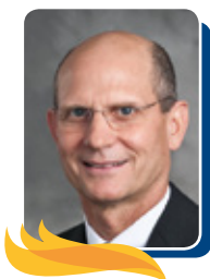
Тед Вильсон, президент Генеральной Конференции

Б ратья и сестры, подобно вкусной пище каждое утро вкушайте Слово Божье. Для нас, жителей XXI столетия, это особенно важно, так как мы приближаемся к завершению земной истории. Евро-Азиатский дивизион насчитывает более трехсот миллионов человек, адвентистов из них — 111 000. Это большой вызов для вас как руководителей церкви. Каждый день просите у Господа видения для продвижения и распространения миссии Церкви на вверенных вам территориях, и Господь позаботится о том, чтобы такие возможности у вас были.