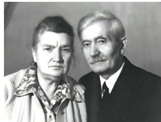
Полвека вместе (золотая свадьба).