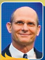
Тед Вильсон, президент Генеральной Конференции Церкви АСД

«Я есмь истинная виноградная лоза, а Отец Мой — виноградарь. Всякую у Меня ветвь, не приносящую плода, Он отсекает; и всякую, приносящую плод, очищает, чтобы более принесла плода... Пребудьте во Мне, и Я в вас. Как ветвь не может приносить плода сама собою, если не будет на лозе, так и вы, если не будете во Мне. Я есмь лоза, а вы — ветви; кто пребывает во Мне, и Я в нем, тот приносит много плода; ибо без Меня не можете делать ничего» (Ин. 15:1–5).