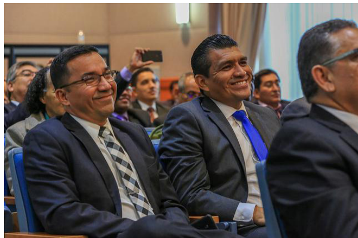
Руководители церковью Сальвадорского унияна улыбаются, когда Эли Генри представили как нового президента Церкви АСД в Центральной Америке.

Леонард Джонсон, заместитель секретаря Пасторской Ассоциации Интерамериканского дивизиона и президент Атлантического Карибского унияна, был рекомендован в качестве следующего исполнительного секретаря Интерамериканского дивизиона.