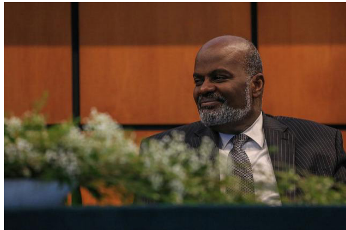
Эли Генри был избран следующим президентом Церкви АСД в Центральной Америке.