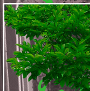
PANTONE® Zaokskyish Green

УЧИТЕЛЬ НАЧАЛЬНЫХ КЛАССОВ УЧИТЕЛЬ АНГЛИЙСКОГО ЯЗЫКА ГРАФИЧЕСКИЙ ДИЗАЙН И ОСНОВЫ ПРОГРАММИРОВАНИЯ