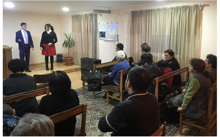
ста: «Идите и научите все народы» исполняются в их церкви и для жителей их города.

После каждой встречи участники программы получали в подарок христианские книги, а в последний день им вручили самую ценную и ожидаемую книгу – Библию. Община города Гюмри благодарит Бога за то, что слова Иисуса Христа: «Идите и научите все народы» исполняются в их церкви и для жителей их города.