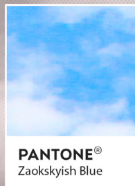
PANTONE® Zaokskyish Blue