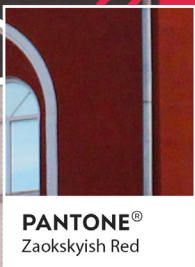
PANTONE® Zaokskyish Red

* Для получения более подробной информации о 75% скидке на обучение пишите нам в соц. сетях или на e-mail: secradf@zau.ru