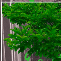
PANTONE® Zaokskyish Green