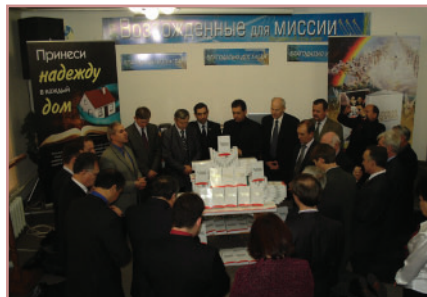
Молитва посвящения над книгой ВБ в Кавк. Ун. Миссии