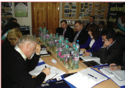
14.11.2011г. Консулт. Встреча с директорами ОИС и АКЦ КСМ.