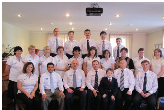
Встреча директоров ОИС. ЮУМ, Алма Ата, октябрь 2011 г.