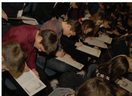
30 октября 2010, Библейская Венгрия

Библия – основа Новой Реформации – (в годовщину Реформации).