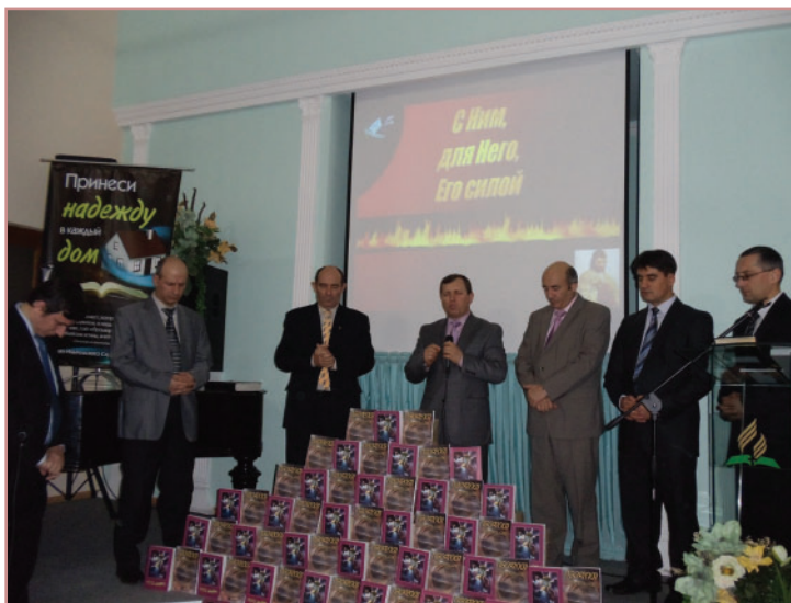
Служение посвящения книги ВБ на грузинском языке в Тбилиси