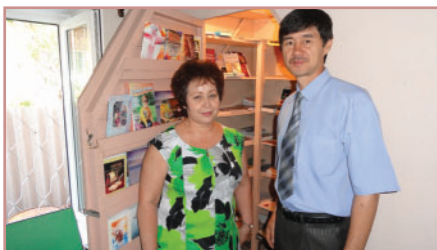
Южная Унионная Миссия Казахстан директор АКЦ и ОИС ЮУМ