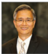
Г. Т. Нг, Секретарь Генеральной Конференции Церкви адвентистов седьмого дня.

И воля Его быстро исполняется Являясь миру с каждым днем и часом, Почки деревьев могут горький вкус иметь, Но сладким будет цвет и плод от Бога.