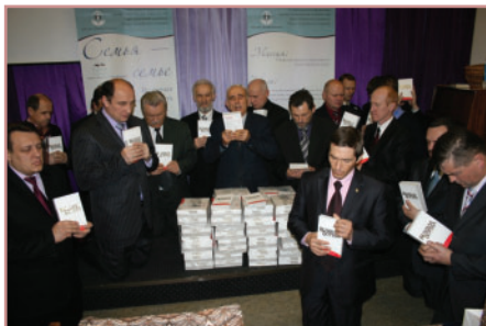
Молитва посвящения над книгой ВБ в Белорусском Унионе Церквей