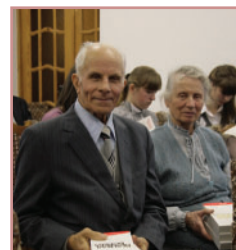
Одухотворенные распространители мисс. книги. г. Минск