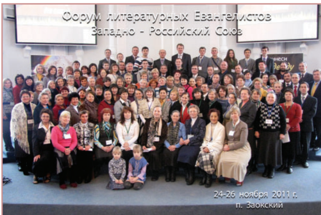
Форум ЛЕ ЗРУК п.Заокский