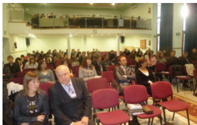
Встреча клуба студентов-ЛЕ в г.Буча УГИ Украина