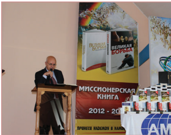
Посв. ВБ ЮУМ 2011, Алма Ата