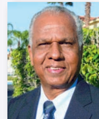
Митро Презентасьян Интерамериканский дивизион, США.