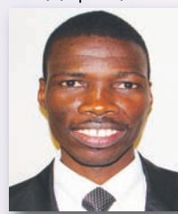
Супер Моози Южный Африканско-Индоокеанский дивизион, Южная Африка.