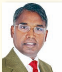
Кальвин Джошуа Издательство «Ази- атский Страж», Индия.