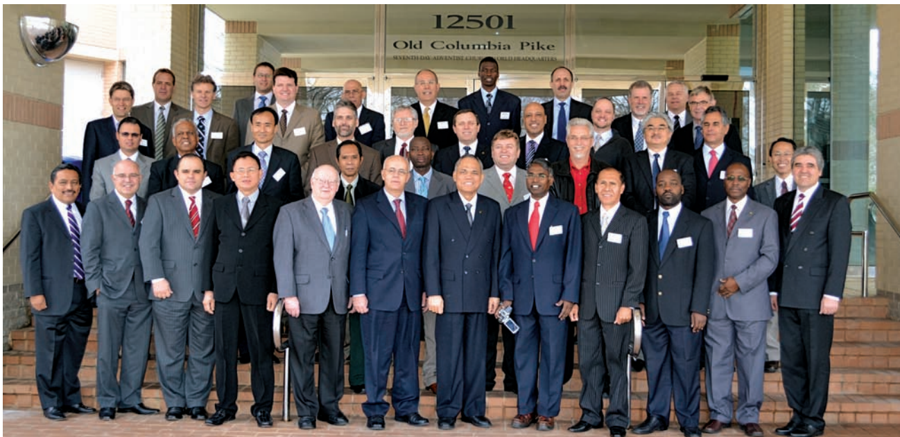
Директора Отдела Издательского Служения мировых дивизионов ГК, 2011 г.