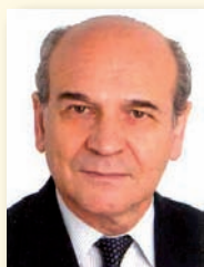
Карлос Пуйоль, Издательство «Сафелиз», Испания.