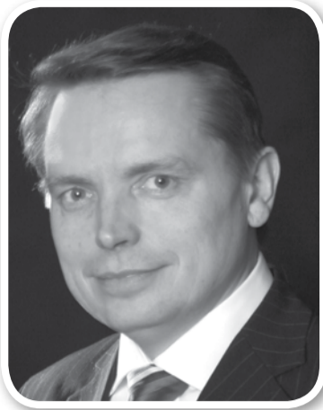
Артур ШТЕЛЕ, ВИЦЕ-ПРЕЗИДЕНТ

ГЕНЕРАЛЬНОЙ КОНФЕРЕНЦИИ ЦЕРКВИ АДВЕНТИСТОВ СЕДЬМОГО ДНЯ