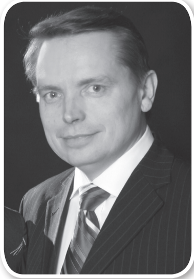
Артур ШТЕЛЕ, ВИЦЕ-ПРЕЗИДЕНТ ГЕНЕРАЛЬНОЙ КОНФЕРЕНЦИИ ЦЕРКВИ АДВЕНТИСТОВ СЕДЬМОГО ДНЯ