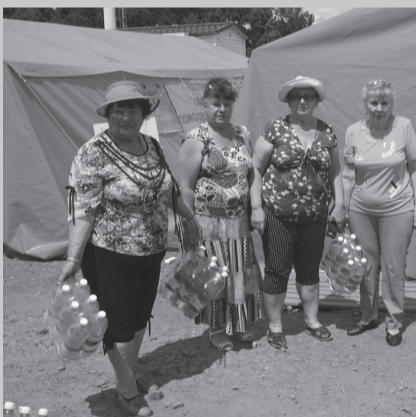
Церковь Шахты-2 побывала в лагере, где встречают беженцев в районе

В последние несколько дней Ростовская область принимает тысячи беженцев из соседней Украины. Там события разворачиваются стремительно, люди, бросая свои дома, бегут в Россию - за помощью, 4 июня донской губернатор ввел на территории Ростовской области режим чрезвычайной ситуации.