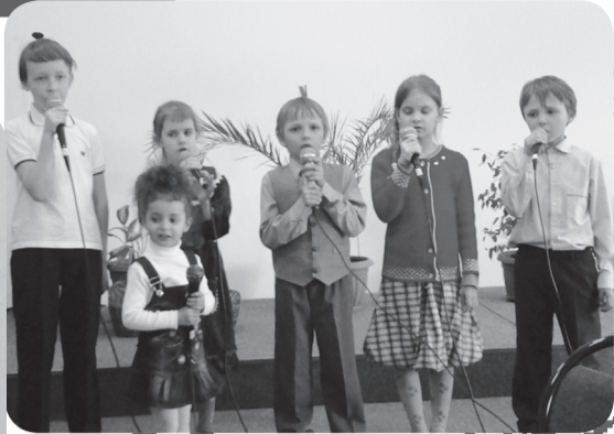
Дети церкви Ростов-4