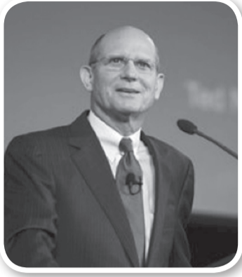
Тед Вильсон, президент Генеральной Конференции Церкви Адвентистов Седьмого Дня

Не знаю, как вы, но я постоянно с этим борюсь. Самая великая битва – это битва с самим собой. Дьявол атакует нас осознанием нашей собственной значимости. С того времени, как он «разбудил» сознание Евы, а затем и Адама, «эго» одолевает каждого из нас. Именно самовлюбленность отторгает нас от силы Божьей. Самовлюбленность не дает увидеть Божий план для нашей жизни, приносит смущение, разобщенность, уводит от Бога.