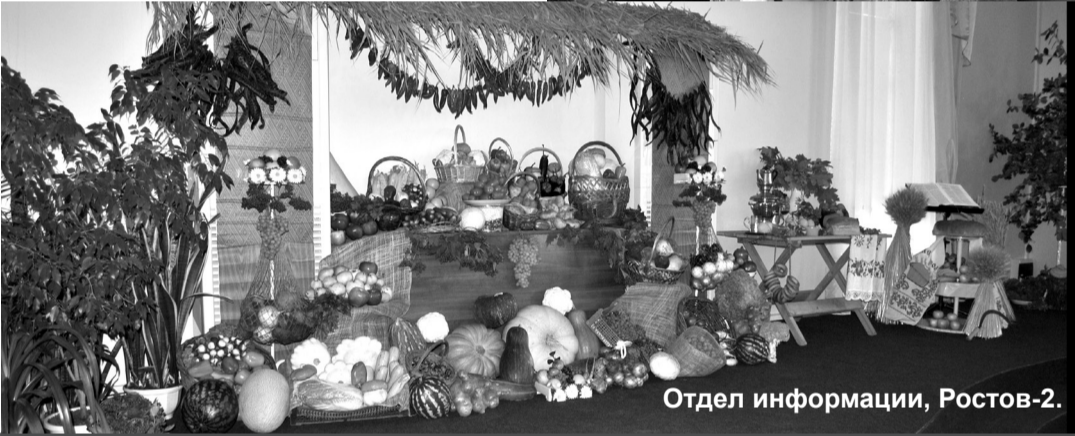
Отдел информации, Ростов-2.