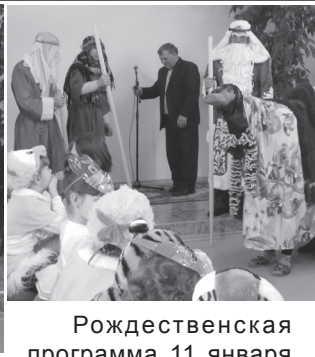
Рождественская программа 11 января была проведена для детей. В программе приняло участие более 40 человек, в том числе почти 30 детей. Программа включала в себя сценки, псалмы в исполнении детей, стихи и много игр. Все дети одеты были в маскарадные костюмы. Все это происходило на фоне путешествия мудрецов, ведомых новой

3 января во второй части Богослужения была проведена праздничная программа для взрослых. На ней присутствовало 29 человек. Пастор Мирче Фиштрига произнес проповедь о рождении Христа, прозвучали стихи, пение. В заключении праздничный обед, за которым общение продолжилось.