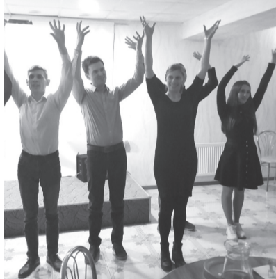
Отдел информации, г. Симферополь

Хотелось бы поблагодарить каждого участника этого вечера и пожелать новых духовных побед!