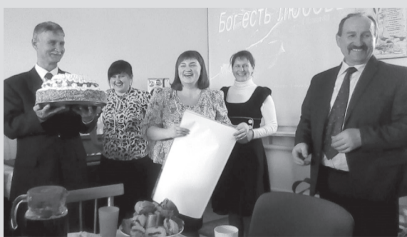
Отдел информации, ст. Вешенская

В завершении этого чудесного субботнего дня очень хотелось повторить слова псалмопевца «Как величественно имя Твое».