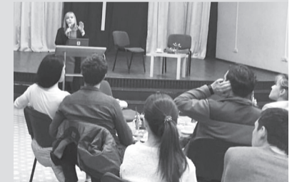
Отдел информации, г. Сочи

Хочется пожелать, чтобы подобные встречи проходили регулярно, и помогали обращать особое внимание на взаимоотношения в наших семьях.