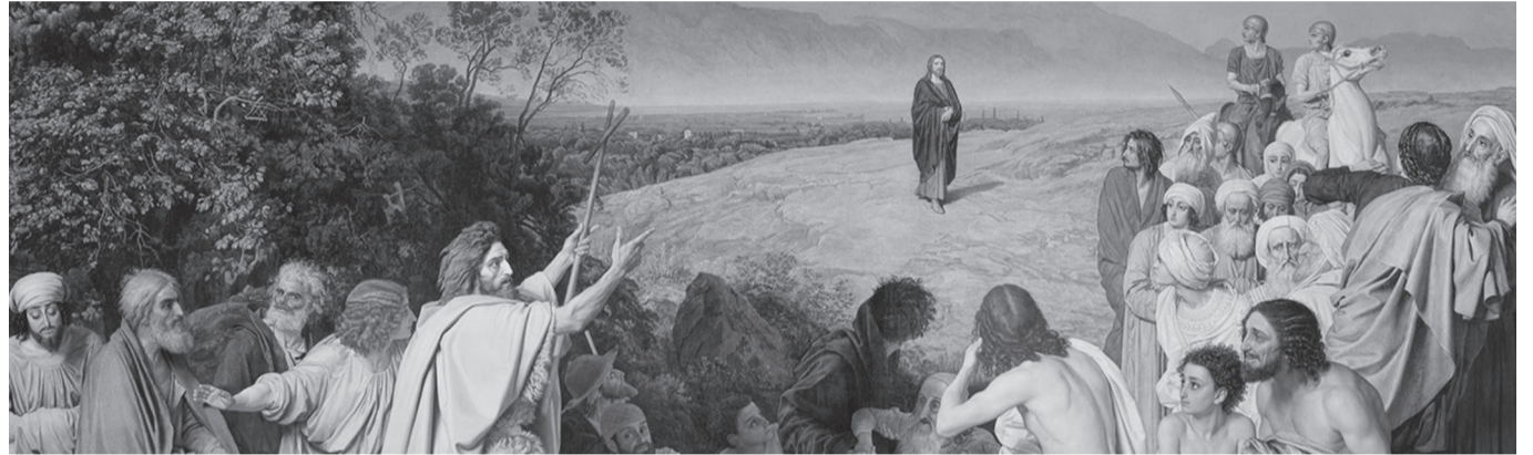
«Александр Иванов, картина «Явление Христа народу» (1837-1857гг.)

Слово Божие приглашает нас быть чистыми, потому что на страницах Священного Писания мы часто встречаем такие понятия как чистый и нечистый. Соответственно все что имеет отношение к Богу должно быть чистым. А если и есть, что нечистое, то его необходимо из состояния «нечистый» перевести в состояние «чистый», и речь не идет просто о физическом омовении. Бог не оставляет за человеком право самому определять нормы чистоты и поэтому через Свое Слово дает нам ясное понимание внутренней, духовной чистоты и того, что необходимо делать чтобы ее иметь и поддерживать. Как выглядит эта чистота в практической жизни?