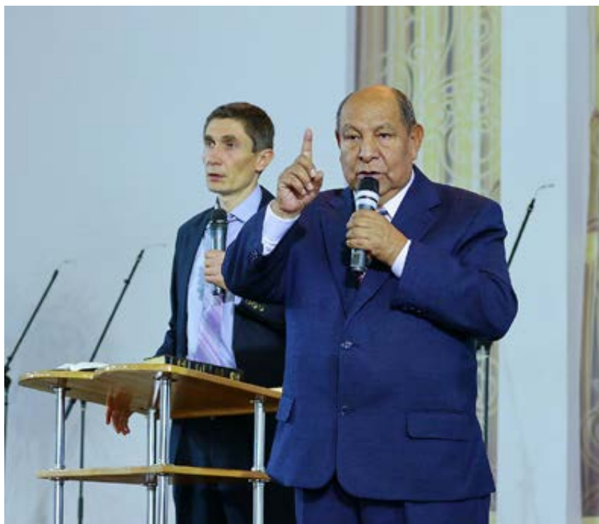
Алехандро Буйон — всемирно известный евангелист и писатель. В течение 47 лет он является пастором адвентистской Церкви.

Главная идея, проходившая красной нитью через все семинары пастора Буйона — каждый христианин призван благовествовать! Каждый