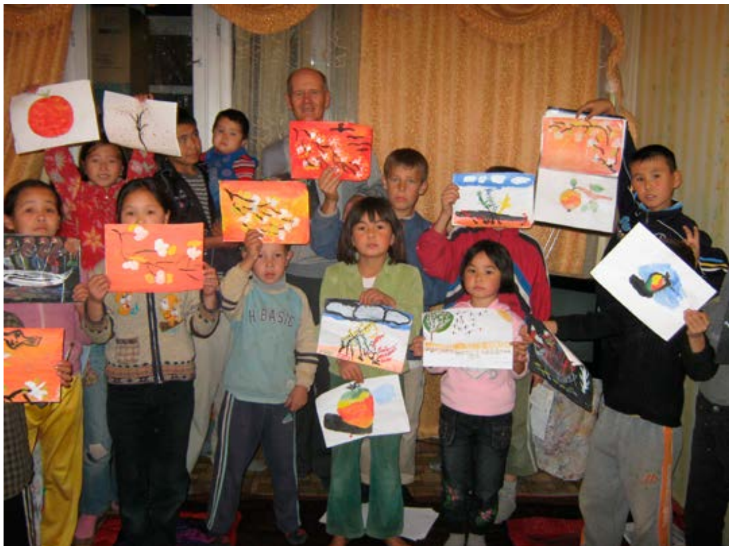
Наш труд в круж. 13лет назад.