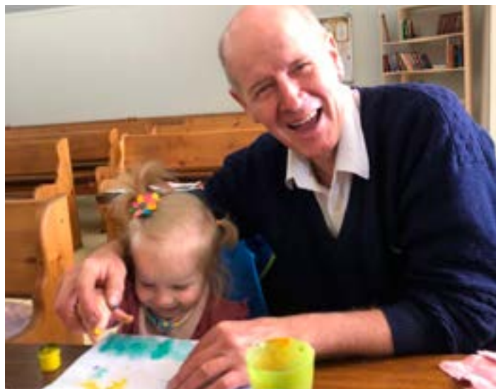
Яне 1.5 года. круж рис.

В тяжелые перестроечные годы я работал учителем в школе. Зарплаты были маленькие, нужно было содержать семью, и я рисовал картины на продажу. Один человек заказал мне три картины на религиозную тему. Я их нарисовал и поставил во дворе, чтобы они на солнце быстрее высохли. Прохожие могли видеть, что происходит во дворе. Соседка-