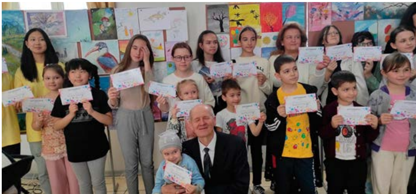
Выставка кружка рисования