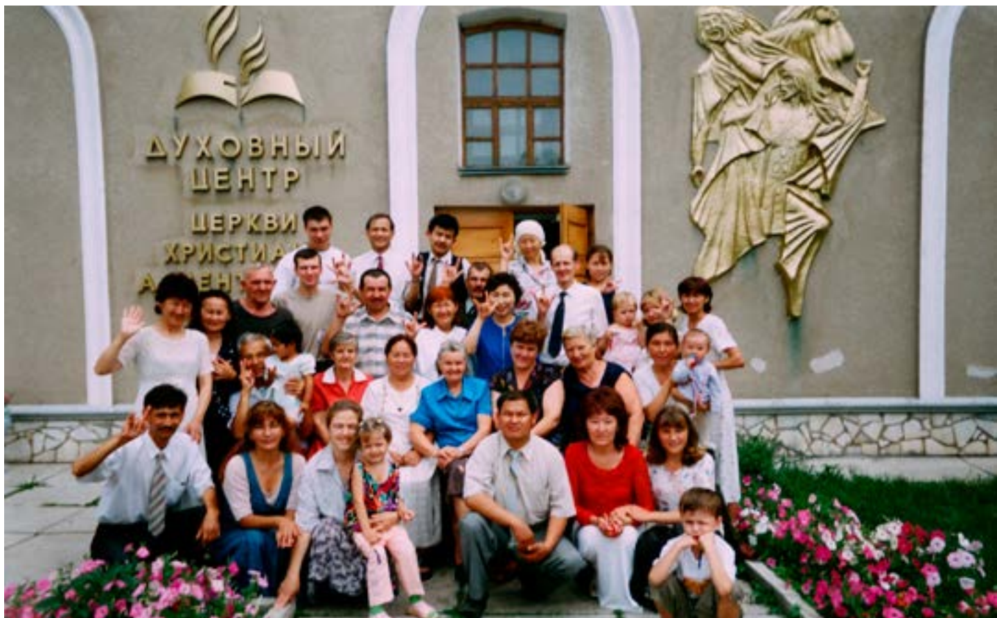
Делегация глухих из Сеула