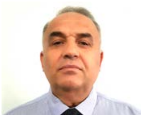
Колтук Фёдор Афанасьевич Президент КаУМ