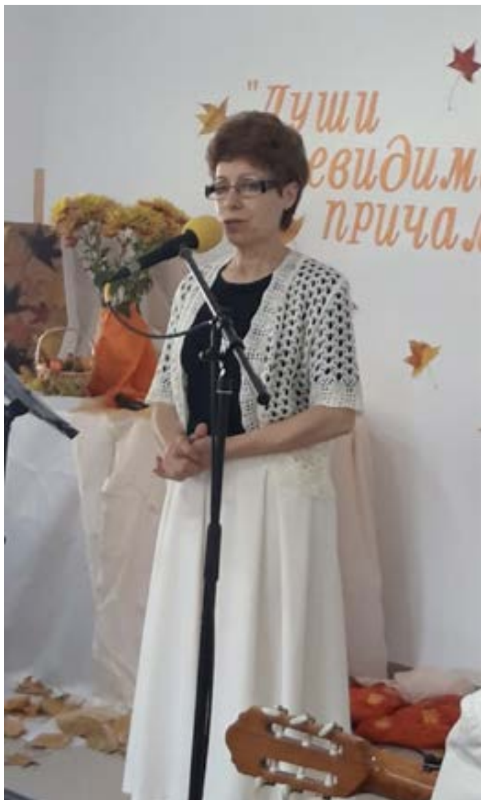
Выступление в Центральной общине г. Сочи

Я думаю, у многих кроме работы есть какое-то увлечение, любимое дело, за которым можно с радостью прово-