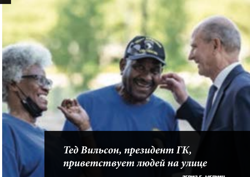
Тед Вильсон, президент ГК, приветствует людей на улице