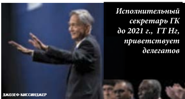
Исполнительный секретарь ГК до 2021 г., ГТ Нг, приветствует делегатов