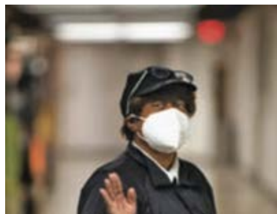
Волонтеры, обслуживающие сессию, приветствуют делегатов и и оказывают им необходимую помощь