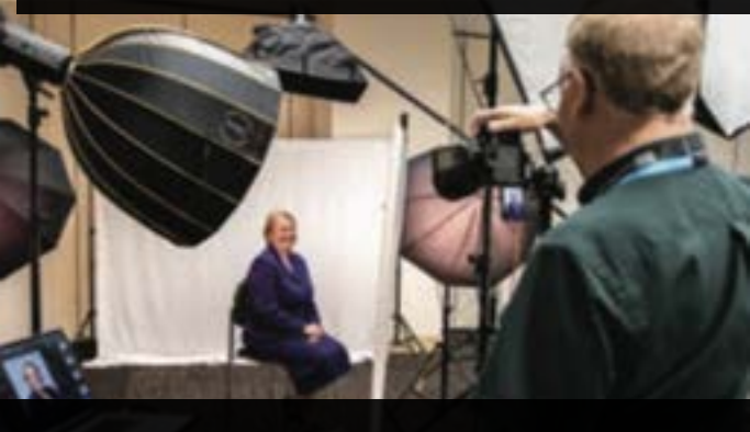
Фотосессия избранных служителей фотографом Adventist Review