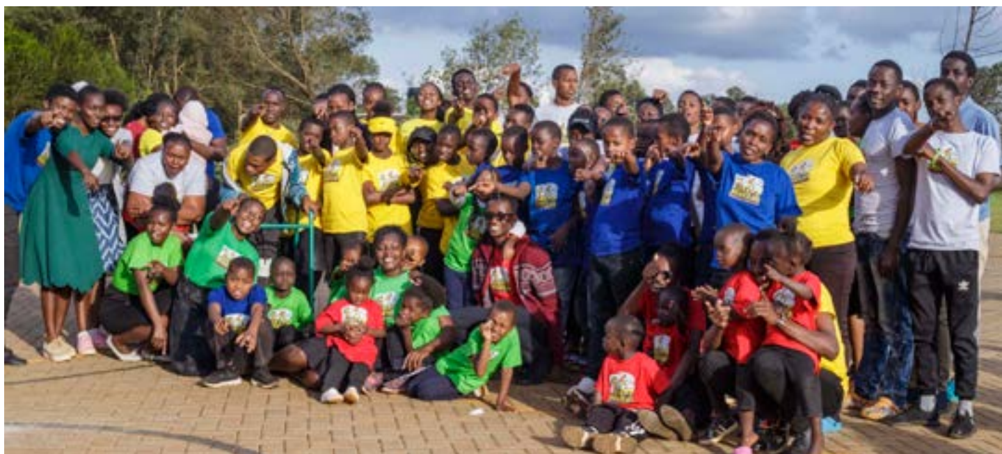
Дети из детского дома Тумаини празднуют завершение своей программы Каникулярной библейской школы.

На данный момент церковь «Новая жизнь» посредством небольшой группы миссионеров провела несколько просветительских мероприятий в Тумаини, таких как, среди прочего, Каникулярная библейская школа (КБШ). Церковные служения иногда приглашают детей и персонал на субботние службы, где они целый день участвуют в веселом служении.