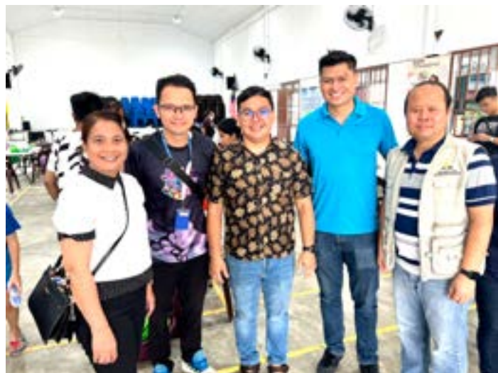
Сотрудничество в исследованиях в сфере здравоохранения

Адвентистская церковь хорошо известна в регионе своей поддержкой здорового образа жизни и оздоровительных практик, объяснили руководители церкви, добавив, что «есть стремление изучить возможности потенциального взаимодействия и сотрудничества с государственными органами для усиления мероприятий по санитарному просвещению и популяризации здорового образа жизни среди жителей Саравака».