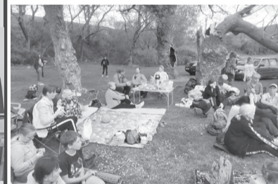
Отдел информации КМ

Встреча получилась очень насыщенной. После дождика природа радовала свежестью, бурным цветением, пением птиц. Собравшиеся могли насладиться совместным общением, духовными размышлениями, песнопениями, вкусными угощениями и спортивными играми. Это время помогло еще больше объединиться и почувствовать себя единой Божьей семьей!